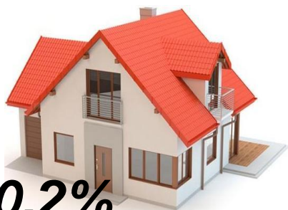
ЖКУ и другие расходы на жилье