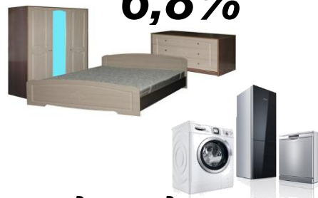
предметы домашнего обихода, бытовая техника и уход за домом